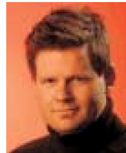
Kjartan Þorbjörnsson/ Morgunblaðið