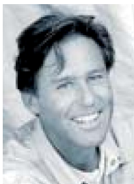
Ragnar Axelsson/ Morgunblaðið