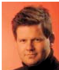
Kjartan Þorbjörnsson/ Morgunblaðið