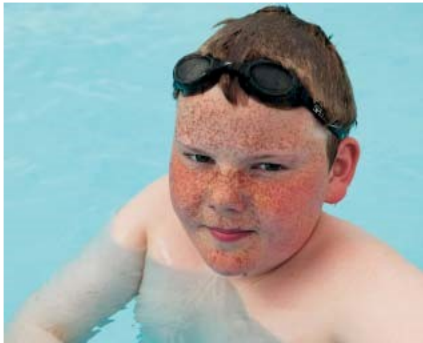
Strákur í sundlaug.