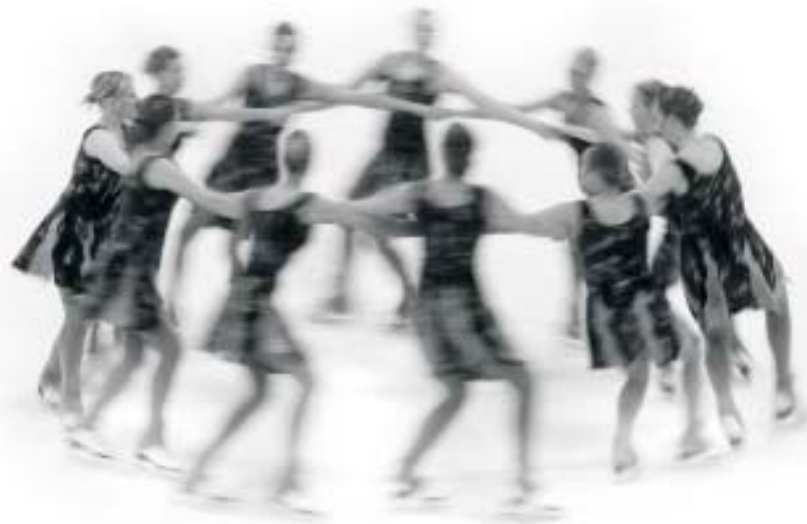
Skautastúlkur á æfingu í Skautahöllinni í Reykjavík.