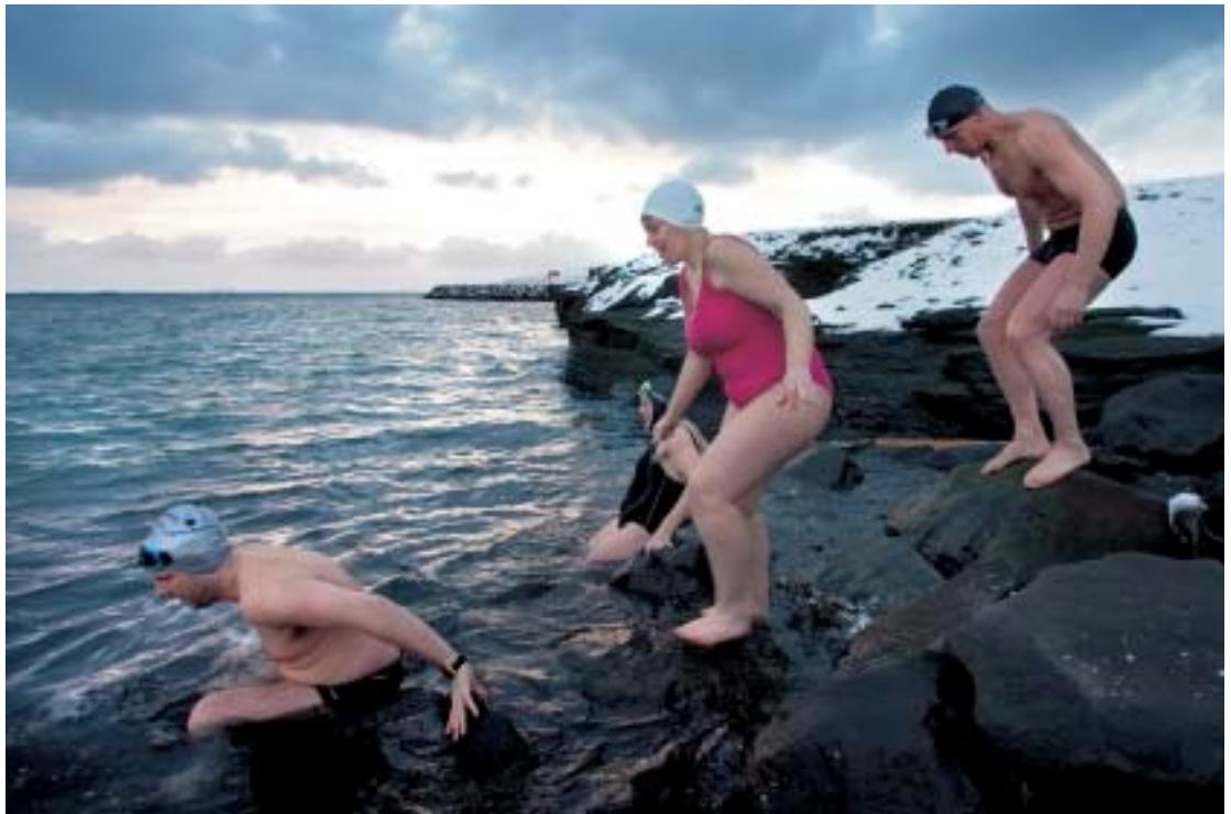
Sjósund um miðjan vetur. Vaskur sjósundshópur sem hittist einu sinni í viku skellir sér í ískaldan sjóinn þótt frostið og kuldinn bíti fast.