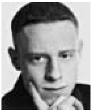
Þorvaldur Örn Kristmundsson/ Morgunblaðið