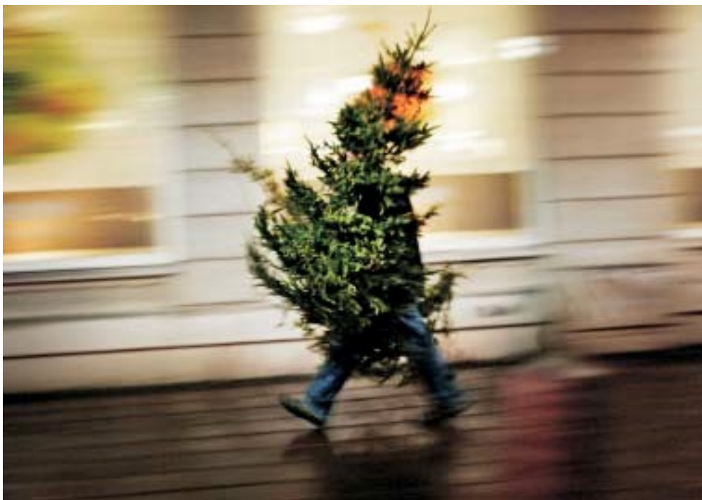
Jólatré á göngu um Pósthússtrætið.