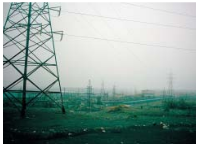
Blaðamannahópurinn ferðaðist með rútu frá Kirkenæs í Norður-Noregi í gegnum bæinn Nikel í Rússlandi og alla leið til Múrmansk. Á leiðinni eru umhverfisspjöllin þvílík að landið verður áratugi að jafna sig. Jörðin er sviðin og svört og maður sekkur ofan í drulluna.