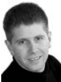
Brynjar Gauti/ Morgunblaðið.