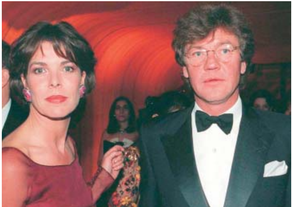
Dómur Mannréttindadómstóls Evrópu í máli Karólinu Mónakaprinsessu, sem hér sést á göðri stundu, gæti haft mjög viðtæk áhrif á starfsaðferðir evrópskra blaðamanna.

Það virðist blasa við að eftirleiðis verði fjölmiðlar að óska leyfis einstaklinga áður en af þeim eru birtar myndir nema ef þær geta talist eðlilegur hluti af fréttæmri frásögn. Til dæmis er stórlega vafasamt að það stæðist að birta