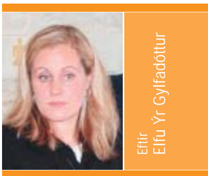
Eftir Elfu Ýr Gylfadóttur

Undanfarna mánuði hafa sjónvarpsmál verið í brennidepli á Íslandi, fyrst í tengslum við fjölmiðlafrumvarpið, síðan vegna innreiðar Símans á sjónvarpsmarkaðinn, og nú vegna kaupa Og Vodafone á Norðurljósum.