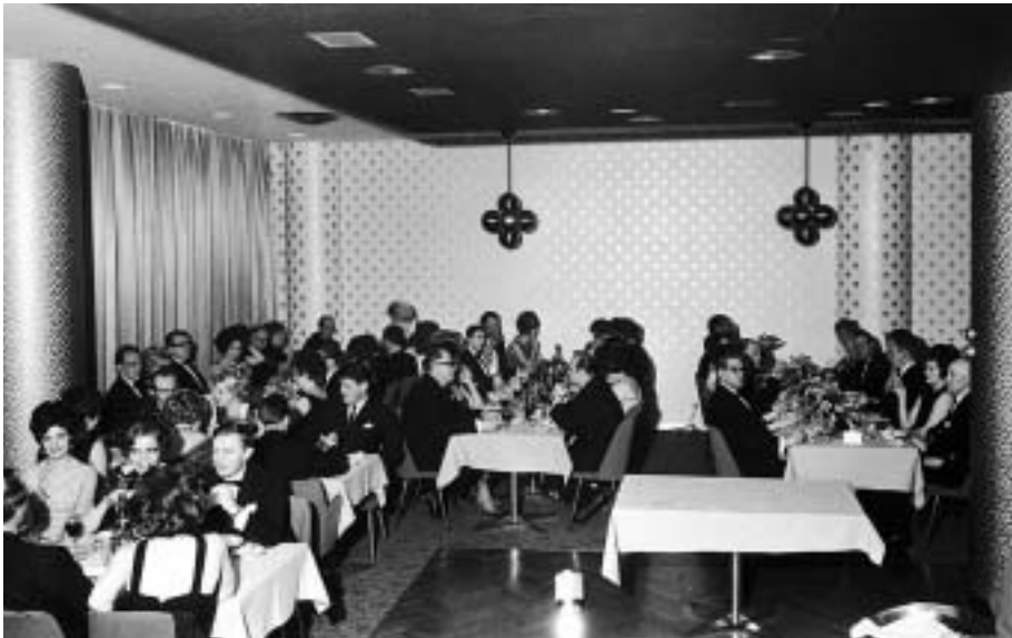
Borðhald. Hér má sjá yfir hluta pressuballs við upphaf borðhalds. Eins og myndin ber með sér er þetta virðuleg samkoma.