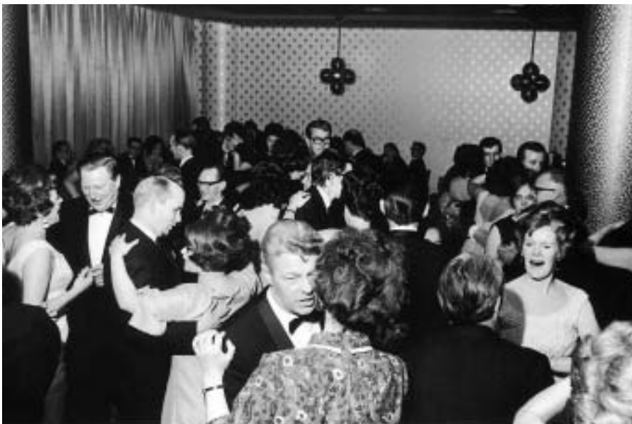
Dansinn. Hér eru pressuballsgestir komnir út á dansgólfið og eins og sjá má hafa danssporin ekki verið vandamál hjá blaðamönnum og gestum þeirra undir lok sjöunda áratugarins.

ævityrablae. Ásóknin í miðana hafði verið svo mikil að nærri lá vandræðum. Við Atli vorum, eins og oftast, með fyrirframsóluna niðri á Morgunblaði og fengust miðar út á nöfn. Gerði þá í upphafi enn eftirsóknarverðari.