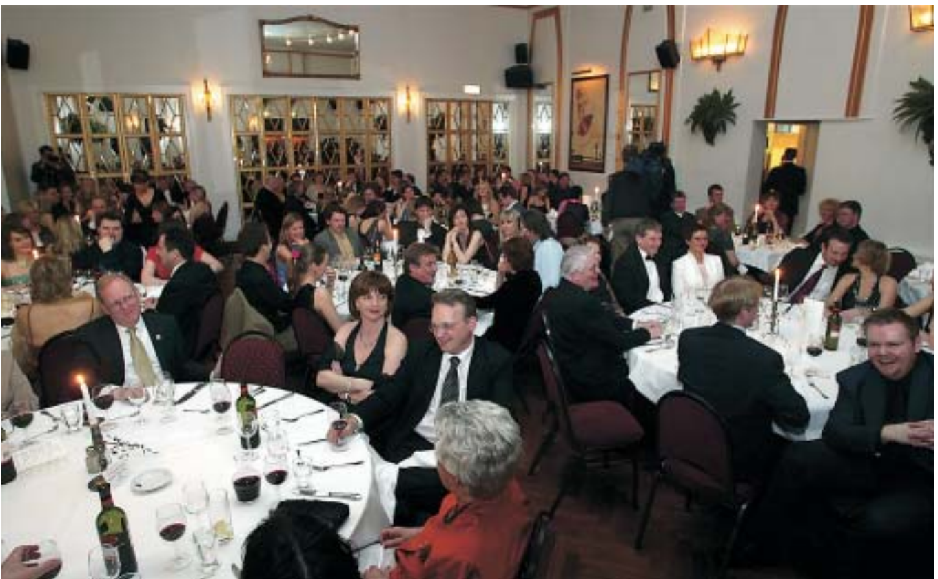
Prúðbúið fjölmenni var á pressuballinu á Hótel Borg í fyrra.