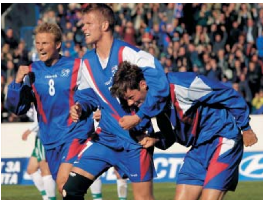
Úr leik íslenska landsliðsins. Engin sambærileg könnun er til um íslenska íþróttafréttamennsku.

Hann bætir því við að ritstjórar og útgefendur – ekki síður en íþróttablaðamennirnir sjálfir – séu ábyrgir fyrir því að vera með eintómt léttmeti og afþreyingu í staðinn fyrir ögrandi umfjöllun um íþróttaiðnaðinum. Því sé það fyrst og síðast á þeirra ábyrgð að tryggja endurreisn hefðbundinna gilda blaðamennsk-