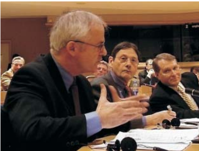
Aidan White, framkvæmdastjóri Alþjóða blaðamannasambandsins, sést hér flýttja málið á ráðstefnu blaðamanna.

hringja viðvörunarbjöllum í flestum fréttastofum og ritstjórnnum Evrópu.