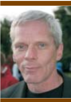
Eftir Kristin Hrafnsson blaðamann

„Starf blaðamanna felst í tilraun til að skrá söguna á meðan hún er að gerast,“ segir Robert Fisk, blaðamaður á Independent í nýútkominni bók. En Fisk gerir sér grein fyrir því að þetta er ekki nægjanleg skilgreining og vitnar í kollega, sem benti honum að á að það væri einnig frumskylda blaðamanna að veita valdhöfum aðhald.