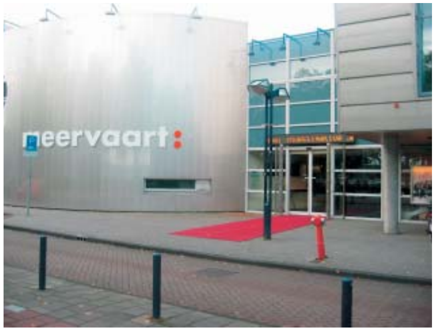
Hollensk-flæmska rannsóknarblaðamannasambandið bauð upp á góða aðstöðu í ráðstefnumiðstöðinni Meervaart í Amsterdam.

Þá eru upplýsingalög mjög misjafnlega vel þróuð í hinum ýmsu löndum. Málsgögn sem dygði að hringja eftir í Svíþjóð gæti verið ógerningur að fá í