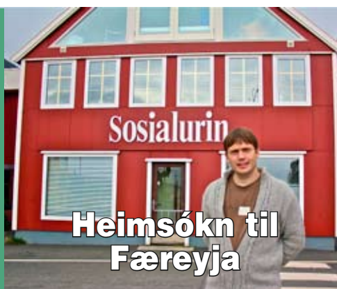
Heimsókn til Færeyja

Yfirskrift, ráðstefnum var fjólmíðlar og kynþáttardómur og umræður þar sýndu áleggjafur útverk og sýndu fjóla löngun- ingarinnu mífelas. Einir sáranna inn á á öðliminn væri að eirileglu samfrág og tryggjað innflytjum og rum minni hlutum þum þari gæta hátt undir höf og öðum samfélags- hópum. Á þar minni á að fjöldi ölar gegndu á haldsverkum gagnvart stjórnvöldum fyrir ind innflyjenda eins og annarra samfélagshópa þótt raddir þeirra væru ekki eins há-