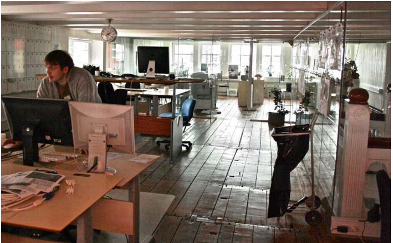
Blaðið er unnið með Apple-tölvum og allir blaðamenn fá ferðatölvu og farsíma frá blaðinu.

Hann skýrir árangur Sósíalsins fyrst og fremst með vinnusemi og skipulagningu. Reksturinn hafi lengi gengið vel og betur eftir að Dimmalætting og Sósíalurinn sameinuðust um prentsmiðju árið 2000. Þá gat Sósíalurinn loks prentað í lit eins og Dimmalætting. Þessi prentsmiðja er í eigu blaðanna beggja og þau sameinast einnig um dreifinguna.