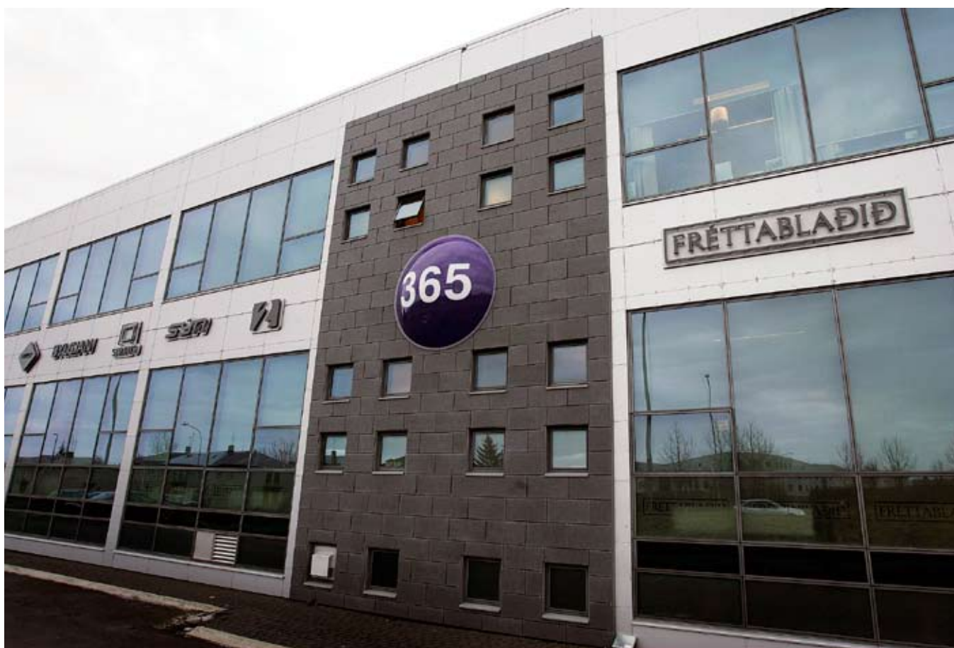
Stjórn 365 miðla samþykkti nýjar siðareglur fyrir fjölmiðlasamsteypuna síðastliðið sumar.

annars vegar og svo blaðamanna hins vegar. Í öllum tilfellum kemur í ljós að báðir þessar hópar kunna að hafa yfir að ráða tæknilegri færni, sem vissulega er hluti af hinni faglegu blaðamennsku, en á endanum er það hinn siðferðilegi þáttur sem ákvarðar hvers eðlis starfsemin er. Þessa áherslu má t.d. sjá í greinargerð Evrópusambands blaðamanna (EFJ) fyrir fjölmiðlaráðstefnu Evrópuráðsins um nýmiðlun og fjölmiðlun á breyttum tímum, sem haldin var í Reykjavík sl. vor. Í þeirri greinargerð er meginþungi lagður á að hin siðferðilegu viðmið blaðamenskunnar, sem m.a. gera kröfu um að búið sé að sannreyna upplýsingar og meðhöndla með ákveðnum hætti, séu það sem skilji milli raunverulegrar blaðmennsku og almennra skoðanaskipta á netinu