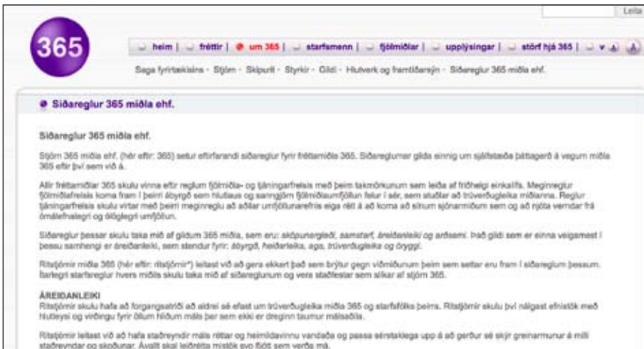
Siðareglur 365 miðla eru birtar á heimasíðu fyrirtækisins.

móti eru þessar reglur 365 miðla sérreglur sem útfæra frekar ýmis þau grundvallarviðmið sem sett eru fram í siðareglum B.Í. Fjögur megingildi 365 miðla eru: Sköpunargleði , arðsemi , áreiðanleiki og samstarf . Ekkert þessara gilda þarf í sjálfu sér að stangast á við þau grundvallargildi sem fram koma í siðareglum blaðamanna eða í þeim boðskap sem úrskurðir siðanefndar fela í sér. Ef grundvallarhlutverk blaðamanna er skilgreint þannig að blaðamenn leitir uppi allar þær upplýsingar sem máli skipta fyrir almannaheill og segi frá þeim , þá er það helst gildið „arðsemi“ sem hugsanlega gæti stangast á við þetta hlutverk. Hins vegar túlka siðareglur fyrirtækisins arðsemisgildið á þann hátt að meginþunginn verður á traust, og að arðsemi af rekstri miðlanna sé í raun fall af trausti þeirra, tiltrú og virðingu. Þannig er arðsemisgildið í raun látið búa til önnur siðferðileg viðmið, sem lúta að ýmsum grundvallarsjónarmiðum í starfi blaðamanna sem fagstéttar. Þetta eru viðmið s.s. virðing fyrir einkalífi og trúnaður við heimildarmenn. Þessi viðmið eru hins vegar ekki sett fram vegna þess að þau eru mikilvæg og siðleg í sjálfu sér eða hluti af hugmyndakerfi blaðamanna