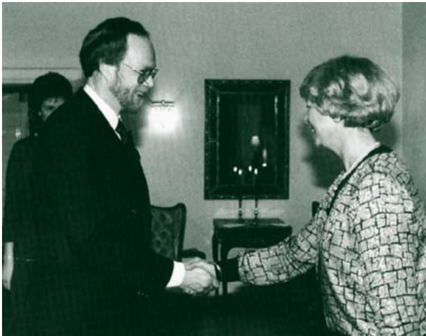
Jónas Kristjánsson sést hér taka í hönd Vigdís Finnbogadóttur, þáverandi forseta. Myndin er ein fjölda mynda sem prýða bókina.

grunnildi og hugmyndir einkenndu þig í dag og gerðu þegar þú sem ungur maður á sjöunda áratugnum lagðir upp í vegferð blaðamennskunnar? Hvernig eru blaðamenn öðru vísi í dag en þá?