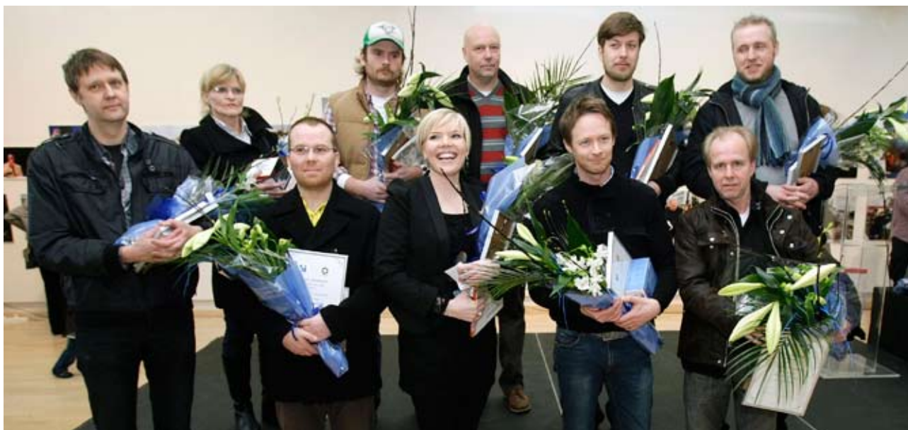
Verðlaunahafar í keppinni „Myndir ársins“.