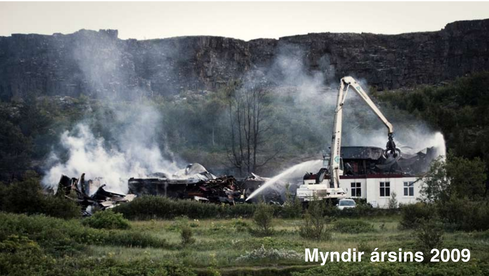
Myndir ársins 2009