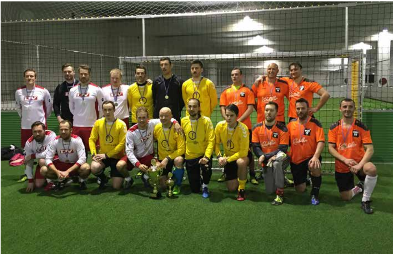
Ríkjandi Sigurvegarar SkjásEins, ásamt liði DV sem var í öðru sæti og liði Sport TV sem var í þriðja sæti.

Morgunblaðið vann tvö næstu mót, 1989 og 1990. Lagði fulltrúa Norðurlands, Dag, í úrslitaleik í fyrra skiptið en 1990 þurfti í fyrsta sinn að útkljá mótið í vítaspyrnukeppni. DV mátti bíta í það