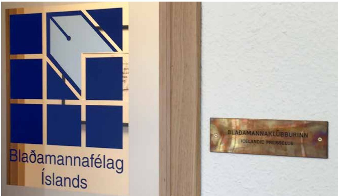
Skiltið um Blaðamannaklúbbinn sem var við turnherbergið á Hótel Borg er nú komið upp í húsakynnum Blaðamannafélagsins.