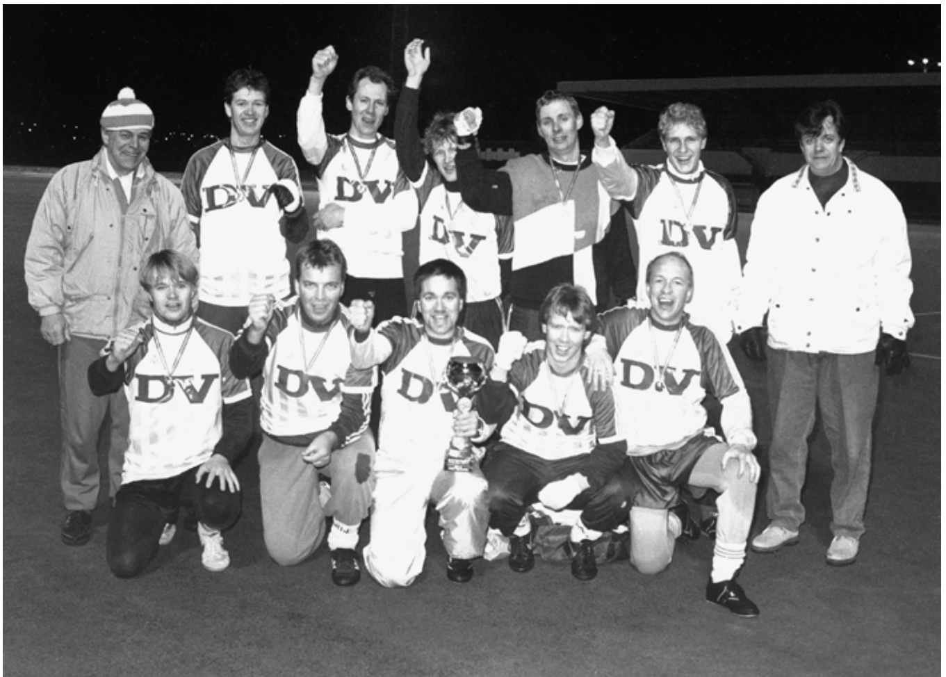
DV var lengi sigursælt og hér sést sigurliðið frá 1988 árið sem farið var að keppa um bikarinn.