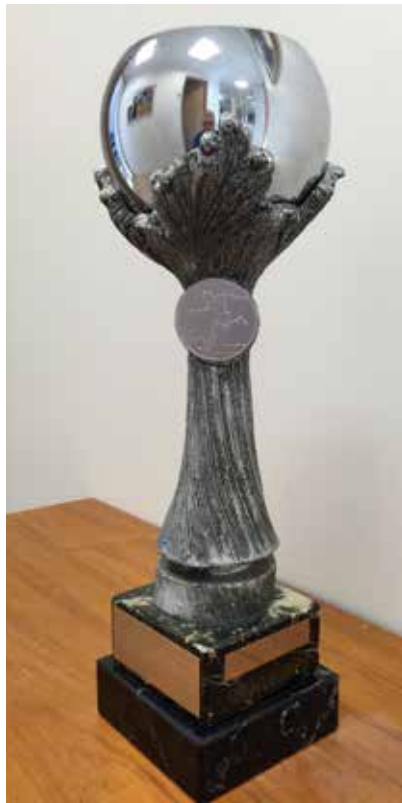
Gamli Fjölmíðlabikarinn er nú í geymslu á góðum stað í húsakynnum Blaðamannafélagsins.