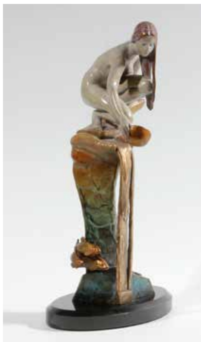
Litla konan við fossinn heitir River Song.