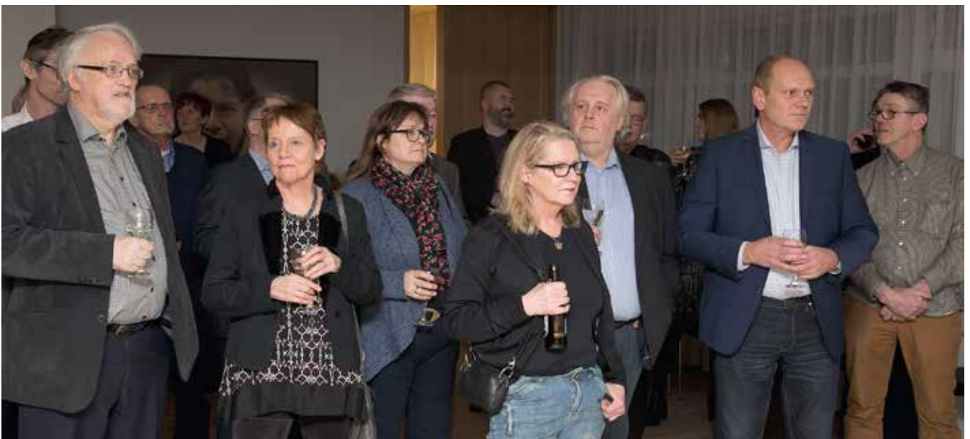
Fjöldmenn var þegar nýi salurinn var formlega tekinn í notkun.