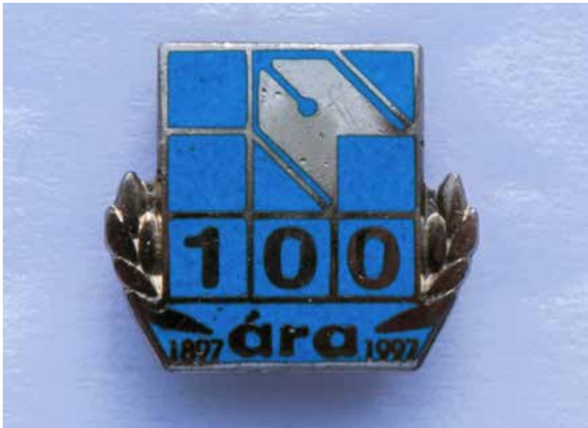
Merki Bláðamannafélagsins sem sumir þurfa að horfa svolítið á áður en þeir sjá bí í lagstöfum sem eru samt svo ótrúlega greinilegir.