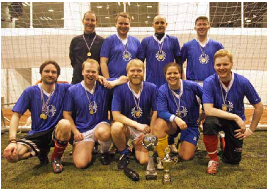
Lið RÚV hefur verið reglulegur þátttakandi í mótinu og árið 2009 unnu þeir mótið.