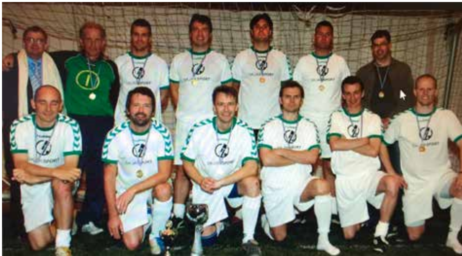
Árið 2006 vann SkjárSport mótið með nokkrum yfirburðum, enda segir greinarhöfundur að það hafi líklega verið best mannaða lið sem tekið hefur þátt í mótinu frá upphafi!