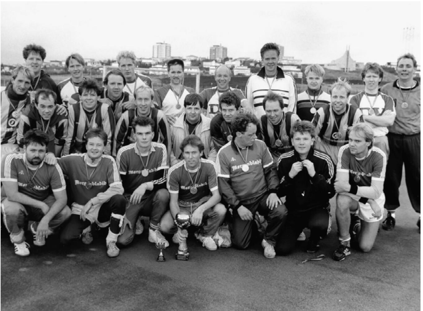
Árið 1989 sigraði lið Morgunblaðsins sem hér sést ásamt liði Dags á Akureyri sem var í öðru sæti og svo lið DV sem varð í þriðja sæti.

og vann mótið. Höfðu félagsmenn í BÍ mismikinn húmor fyrir því.