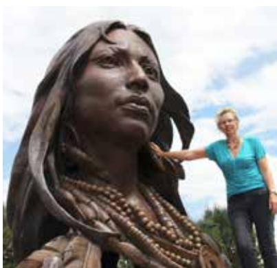
Lost Tribes heitir þetta stóra höfuð sem listakonan hallar sér upp að það er að finna í Avon, Colorado.

Að lokum fáum við að heyra ögn um lífið í Arizona í dag. „Sólin skín hér í Cave Creek 290 daga á ári. Bærinn er gamall námubær sem heldur sjarma villta vestursins þrátt fyrir að vera samvaxinn Phoenix. Hér búa kúrekar, listamenn og golfarar í sátt og samlyndi. Húsið mitt snýst aðallega um