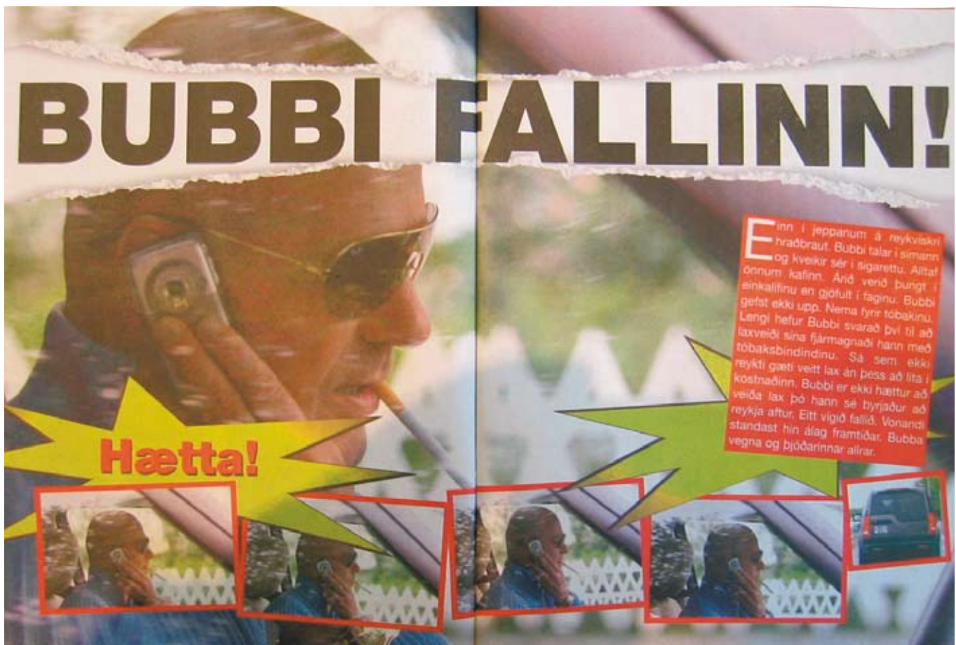
Opnan úr Hér og nú sem Bubbadómurinn fjallar meðal annars um.

Í öðru lagi gætu breytingar á fjölmiðlaflórinni einnig hafa haft áhrif. Aukin samkeppni og markaðsvæðing greinarinnar í heild kann að hafa ýtt undir að miðlar gangi lengra en áður í að birta fréttir sem síðan enda sem dómsmál. Stafræna byltingin og nýmiðlar hafa einnig breytt landslagi svo ekki sé talað um ritstjórnarstefnuna, sem DV fylgdi á tímabili og skilgreindi sem „ágenga“ blaðamennsku. Tilkoma fríblaða skiptir einnig máli í þessu sambandi og þá ekki síst sá síður að