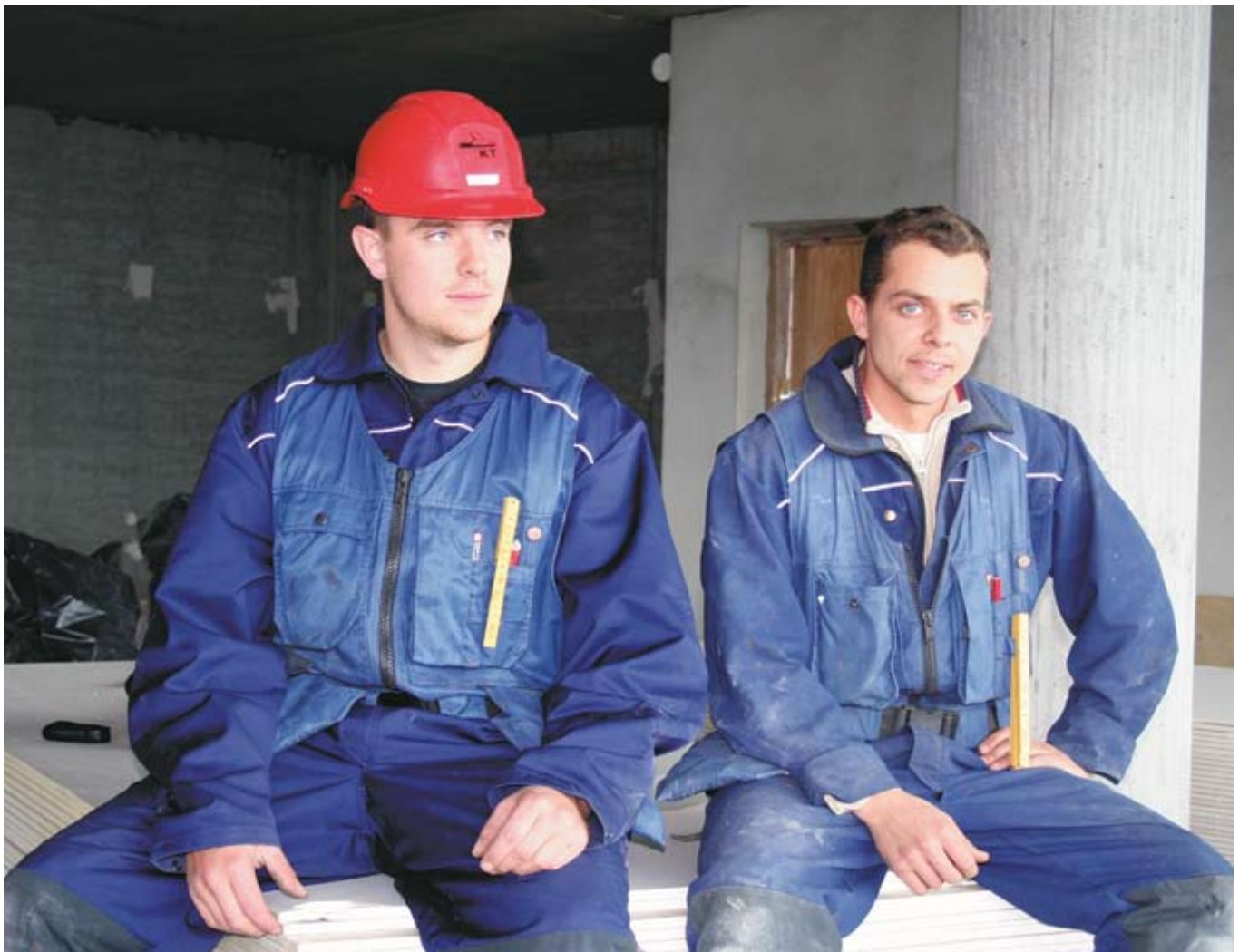
Samskipti innflytjenda og Íslendinga eru mikil á mörgum vinnustöðum. Miðað við mikinn áhuga Pólverja sem hér eru á því að fylgjast með fjölmiðlum ætti að vera leikur einn að halda uppi samræðum um þjóðmálin í kaffitímanum.

vægt að vita hvað er að gerast í íslensku samfélagi og er lítill kynjamunur þar á en ríflega helmingur aðspurðra notar íslenska fjölmiðla daglega eða nær daglega, segir Helga. Flestir fylgjast með dagblöðunum og þar á eftir kemur Internetið, þá útvarp og svo sjónvarp. Þriðjungur Pólverja les íslensk dagblöð daglega eða nær daglega. Fríblöðin eru vinsæl meðal Pólverjanna, en flestir þeirra sem á annað borð lesa blöð, eða um átta af hverjum tíu, lesa Fréttablaðið og tæpur helmingur les 24 stundir. Þegar skoðað er hvað helst er lesið í dagblöðunum eru það gengis- og veðurfréttir, auglýsingar, þ.m.t. smáauglýsingar, og fyrirsagnir, auk þess sem myndir eru skoðaðar. Um þriðjungur fylgist með innlendum fréttum, en nokkuð færri lesa erlendar fréttir.