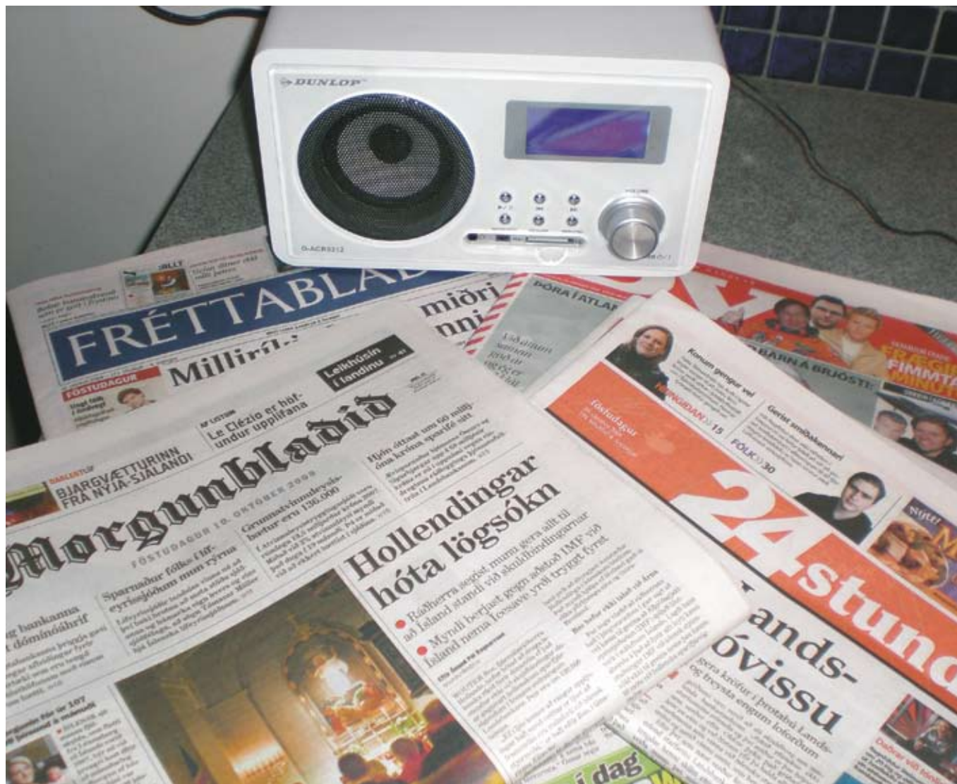
Færst hefur í vöxt að blaðamenn skrifi fréttir og greinar undir fullu nafni og mynd. Slíkt færir þeim bæði fébóta- og refsíábyrgð samkvæmt prentlögum.

verður leitast við að hafa inni í nýja frumvarpinu ákvæði sem almenn sátt var um en sneitt hjá umdeildum ákvæðum, s.s. um hámark á eignarhaldi. Það væri því e.t.v. ástæða til að skoða sérstaklega með hvaða hætti hægt er að samræma hugmyndir um sjálfstæði ritstjóra í nýju frumvarpi og svo þau ákvæði í prentlögum sem gera útgefendur og eigendur fjárhagslega ábyrga fyrir ritstjórnarefni. Farvegurinn sem síðasta frumvarp bjó til fyrir þetta gerði ráð fyrir að útgefendur dagblaða og blaðamenn settu sér reglur um ritstjórnarlegt sjálfstæði í samstarfi við stéttarfélag blaðamanna og að þessar reglur yrðu síðan sendar til útvarpsráðgjafarinnar. Í frumvarpinu, sem ekki varð að lögum, segir m.a.: