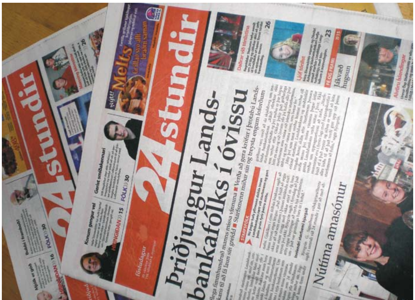
Síðasta tölublaðið af 24 stundum.