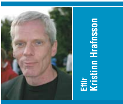
Eftir Kristinn Hrafnsson

„Datt einhverjum í hug að fara að taka viðtal við stjórnendur útrýmingarþjónna nasista í stríðslok til að sýna báðar hliðar mála,“ sagði Robert Fisk, blaðamaður á Independent í eldmessu sinni á alþjóðþingi rannsóknarblaðamanna í byrjun september. Fyrirlestur Fisk var einn af hápunktum ráðstefnunnar í