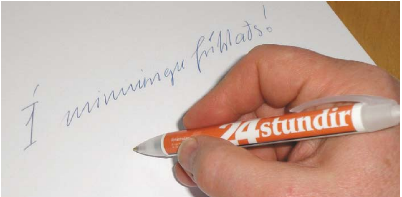
Á ársafmæli breyttis útlits og nýs nafns 24 stunda var blaðið lagt niður.

umtalsverðri sókn á markaði og hefur jafnt og þétt aukið útbreiðslu sína. Frá og með haustmælingum Capacent 2007 voru 24 stundir komnar upp fyrir Morgunblaðið í útbreiðslu og mældist næst útbreiddasta blað landsins á eftir Fréttablaðinu með rúmlega 50% lestur.